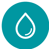
Pedido Agrupado de Toner