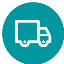
Envio de Toner